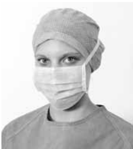
Obr. 1 Správně nasazená operační čepice a operační ústenka. Čepice pokrývá celou vlasatou část hlavy, nosní pásek operační ústenky pevně sedí kolem nosu, dvě tkaničky z každé strany (spodní pod ušima, horní na temeno)

Operační pláště musí být dostatečně dlouhé a uzpůsobené tak, aby zakrývaly celá záda a aby tato část byla po celý operační výkon sterilní.